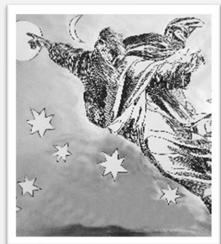
TU FIS LA LUNE ET LE SOLEIL (psaume 103)

Ils vous convient aussi à leur exposition « Psaumes et Cantiques » dans la chapelle de la Vierge (exposition des œuvres graphiques).