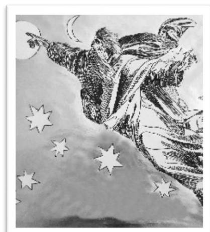
TU FIS LA LUNE ET LE SOLEIL (psaume 103)

Vous pouvez aussi admirer leurs œuvres grâce à l'exposition « Psaumes et Cantiques » installée dans la chapelle de la Vierge.