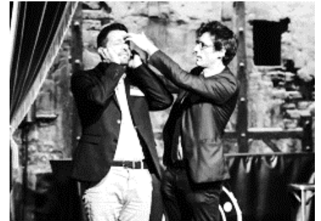
LES ÉTUDIANTS DE SAINT-JOSEPH PRÉSENTENT

Pré-inscription au : 06 16 31 60 44 (Baudouin)